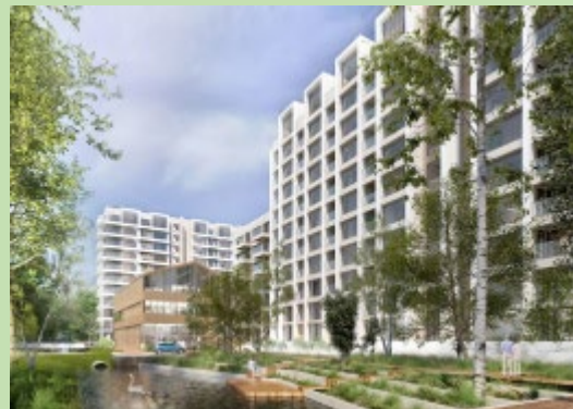
Artist impressie van het complex. Op de binnenplaats zal een gezondheidscentrum verrijzen.

De Gemeente Zoetermeer stelde begin dit jaar een geheel nieuw project voor. Namelijk het verplaatsen van het busstation vanuit de binnenstad naar een nog te bouwen platform boven de A12, gelegen tussen de op- en afrit van de Afrikaweg en de Mandelabrug .